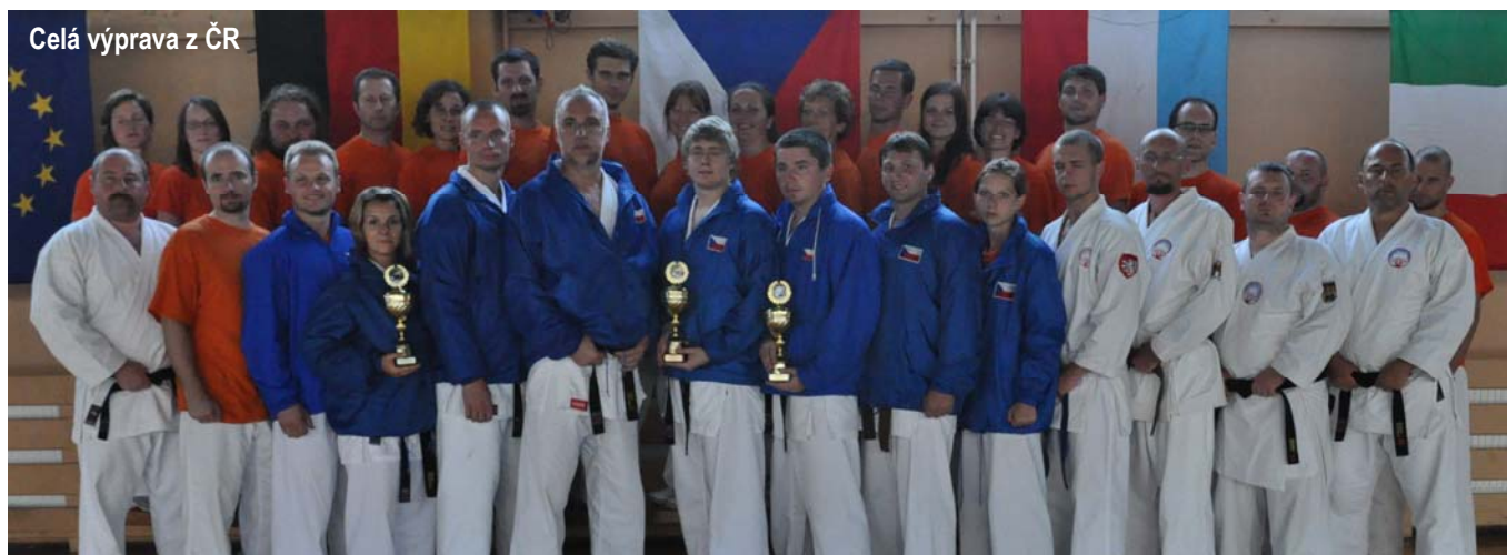
Celá výprava z ČR