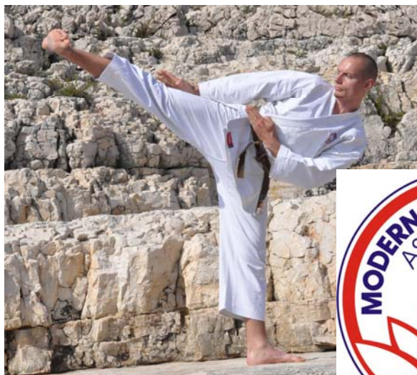
FOTO z AA12 - CHORVATSKO - ostrov Mali Lošinj