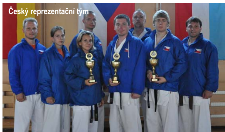
Český reprezentační tým