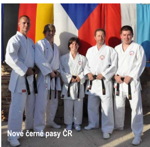
Nové černé pasy ČR